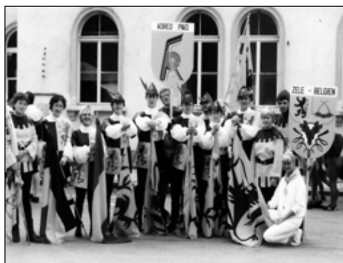
De Vendeliers van Koreo Piko