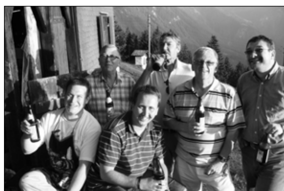
Even bijtanken na een wandeling in het Beierse woud