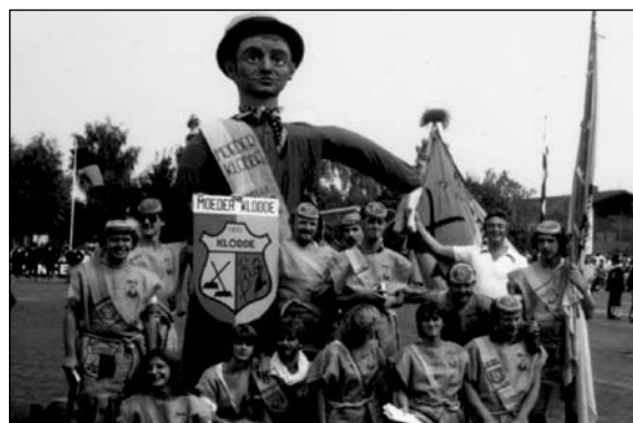
Studentenclub Moeder Klodde met reus Cesar

Ze stelden een klepper van een dossier op dat ze aan beide burgemeesters bezorgden. In Zele werd de vraag gesteld door de oud-leerlingenbond Oud en Nieuw, Koreo Piko, De Minnezangers, het Pius X-instituut, de Pinksterfeesten, turnkring 'Vlug en Vroom' en studentenvereniging Moeder Klodde. Zowel in Cham als in Zele kwam het licht op groen. En dus wordt 9 oktober een memorabele dag, Zele krijgt eindelijk een partnerstad.