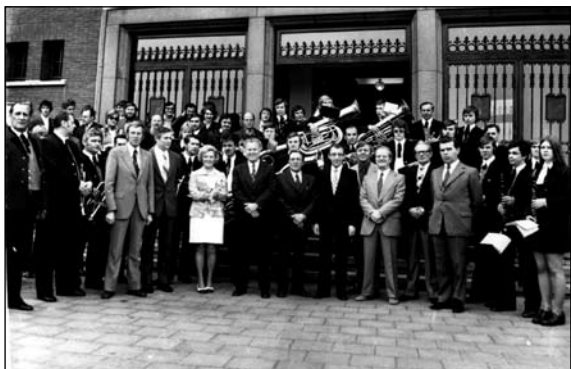
Het Kolping Musik uit Cham wordt door het gemeentebestuur ontvangen (1974).